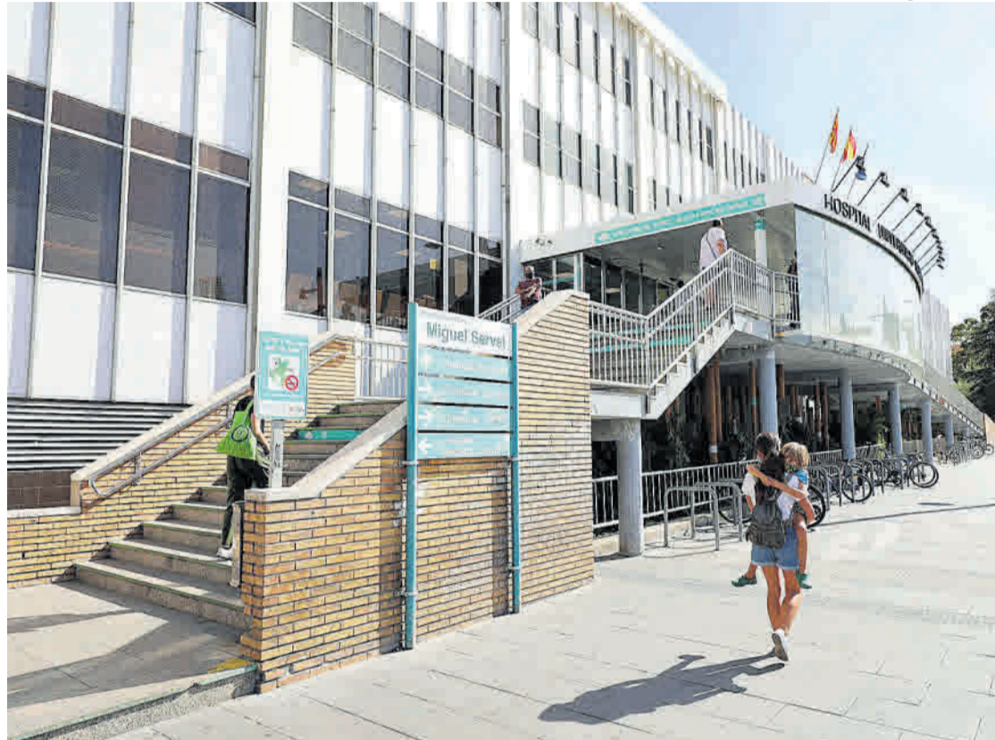
Sanidad. Entrada al hospital Miguel Servet de Zaragoza que la semana pasada tenía mucha gente en urgencias.

Como en los centros de salud hay pocos médicos y pocos medios,